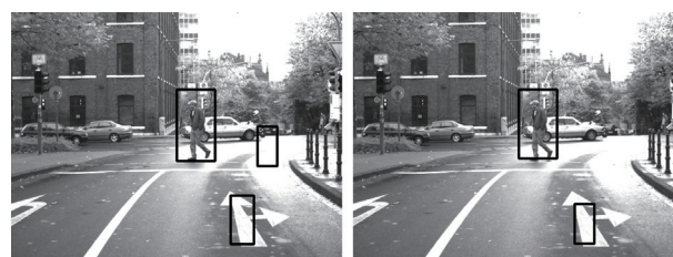
(a) 環境適応前 (b) 環境適応後